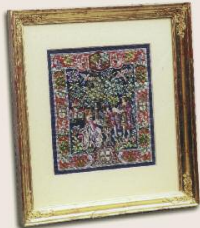
Данная картина в позолоченной деревянной рамке вышита в соответствии с гобеленом Клуни, имеет 225 стежки на см2.