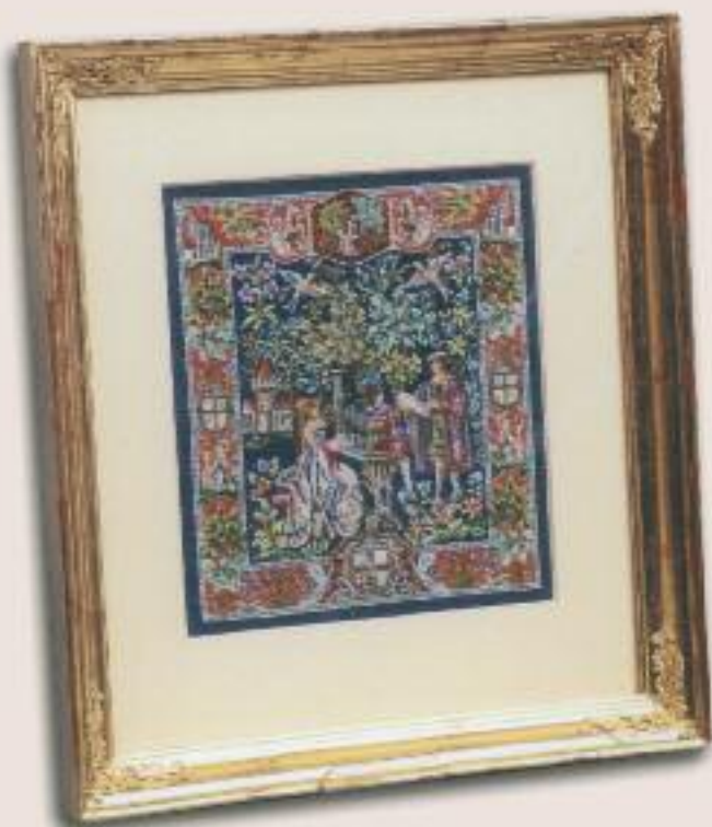
この金メッキの模様はクルニのゴブラン織りをモチーフとしたものです。 一平方センチメートルあたり225のステッチです。